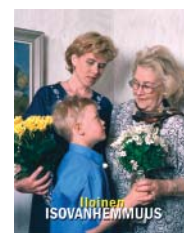
Isovanhempien päivän juliste