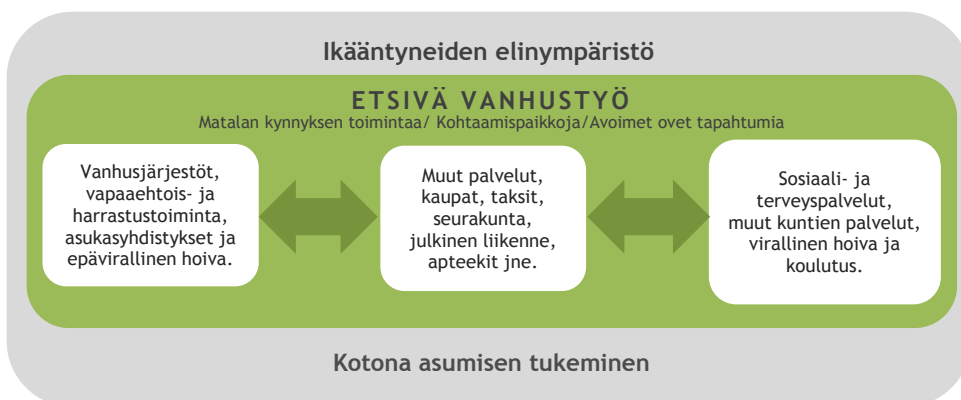
Kuvio 1. Etsivän vanhustyön kenttä

Etsivään vanhustyöhön tarvitaan lisää rahaa. Siihen kannattaa panostaa, sillä pitkällä aikavälillä se säästää rahaa. Etsivään vanhustyöhön panostamalla ehkäistään ikääntyneiden raskaisiin hoitoihin joutumista, vähennetään terveyspalvelujen