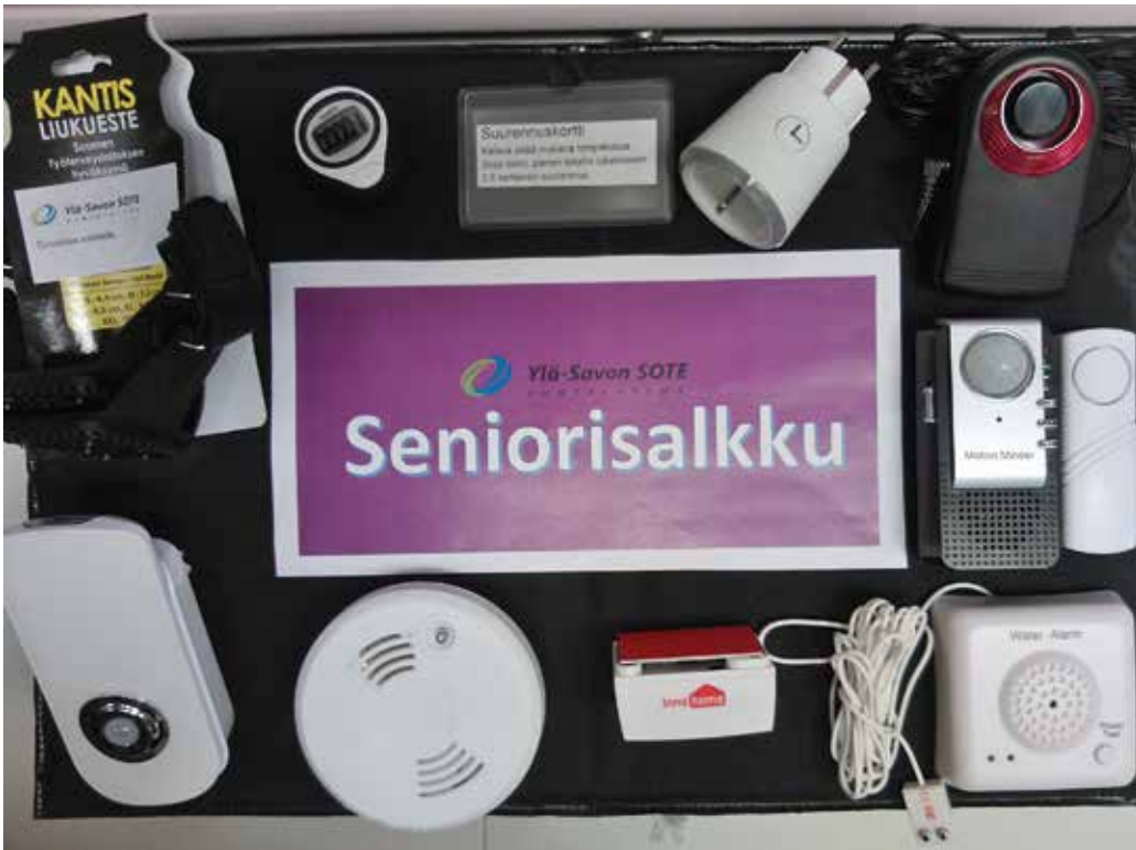
Seniorisalkun sisältöä.