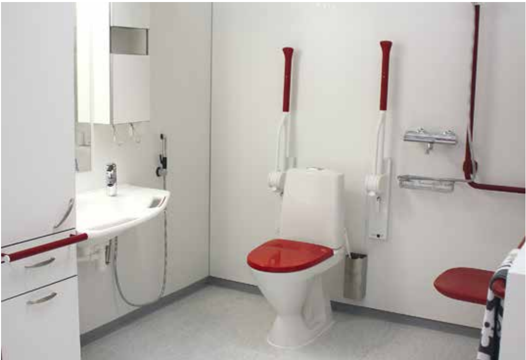
HYTEKS-tilan WC.