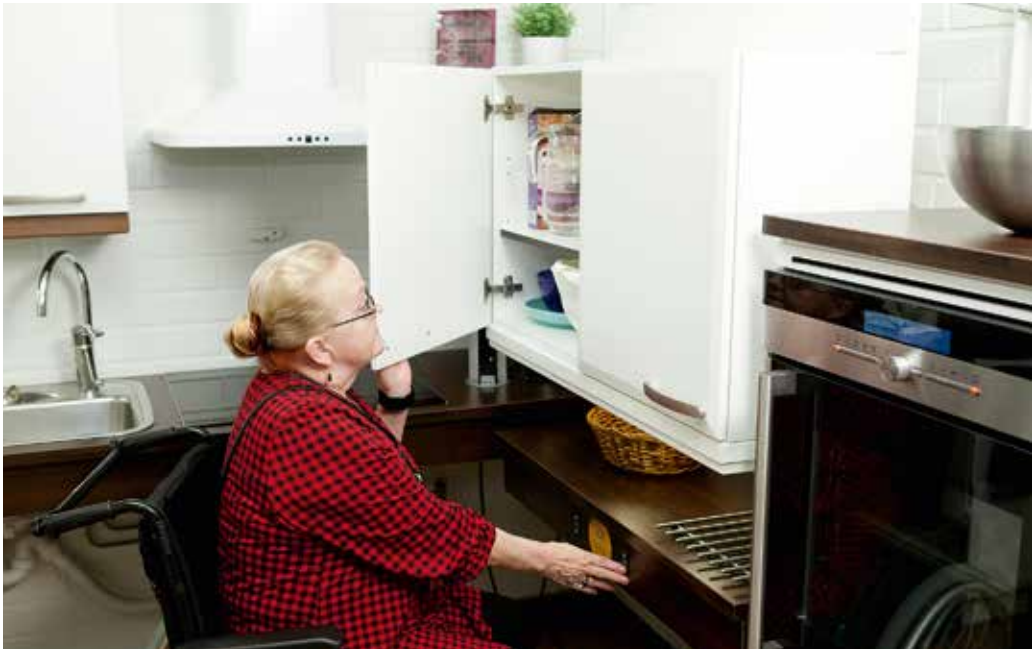
Kunnonkodin keittiötila.

Turun ammattikorkeakoulun opiskelijat tekevät harjoittelujaksoja Kunnonkodissa ja osallistuvat myös opastustyöhön. Lisäksi he käyvät esittelemässä tuotteita tapahtumissa, kuten messuilla, hoito- ja palvelukodeissa ja yhdistysten tilaisuuksissa. Toimintaa kehitetään jatkuvasti ja tähtäimenä on muun muassa moniammatillisen yhteistyön laajentaminen Turun ammattikorkeakoulun opiskelijoiden kesken ja tuotetestaustoiminnan monipuolistaminen.