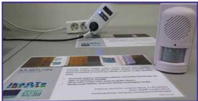
Jelppisalkun tuotteita.