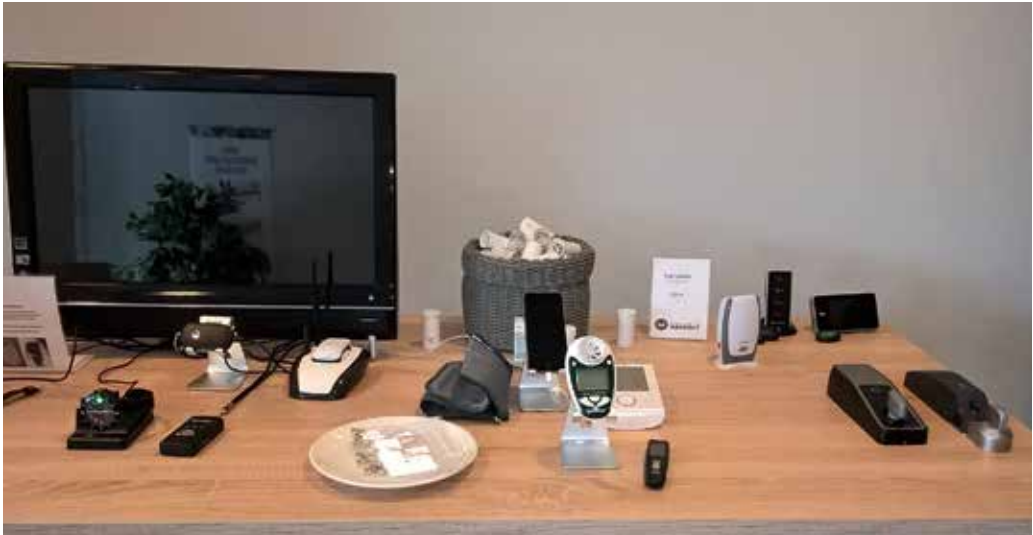
Telelääketieteen keskus.

Vanhus- ja vammaisneuvostojen edustajat kertoivat lisäksi näkemyksensä siitä, kenen tai minkä tahon tulisi järjestää ikäteknologian käytön ohjausta ja neuvontaa sekä arvion, miten paljon ohjaukselle ja neuvonnalle on tarvetta. Vanhus- ja vammaisneuvostojen edustajien enemmistö arvioi, että sellaisille ohjaus- ja neuvontapaikoille on tarvetta, missä voi tutustua arkea helpottaviin teknisiin laitteisiin ja saada ohjausta niiden käytössä. Noin kaksi kolmasosaa vastaajista kuitenkin kertoi, että tämänkaltaisten neuvontapaikkojen tarpeesta ei ole laajemmin keskusteltu vanhus- tai vammaisneuvostossa. Viisikymmentä vastaajaa kertoi, että tarpeesta on joko käyty keskustelua tai sitä on sivuttu muissa keskusteluissa. Kysely myös selvästi viritti keskusteluun, sillä kaksikymmentä vastaajaa totesi, että vielä ei olla keskusteltu, muutta varmaankin olisi aiheellista keskustella. Muutama myös totesi, että neuvosto on melko uusi, ja myös vastaaja neuvostossa tuore, joten keskustelua ei vielä olla ehditty käydä