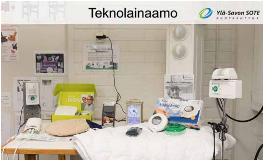
Teknolainaamon tuotteita.