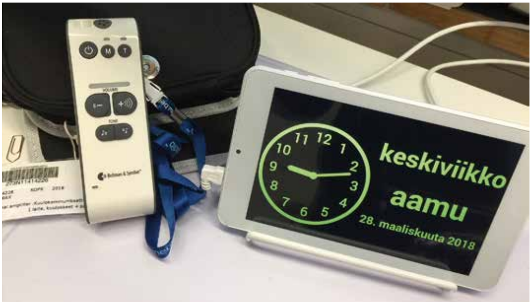
Kolarin kirjastosta lainattavia laitteita ja välineitä.