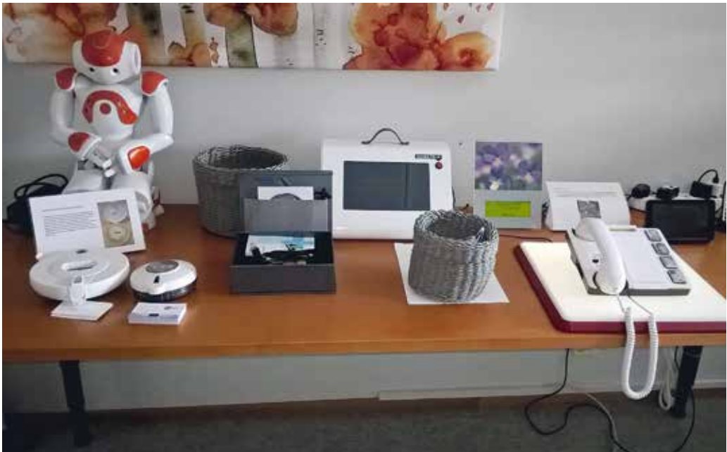
Telelääketieteen keskus.

Myös tämän selvityksen kyselyyn vastattiin aktiivisesti. Kysely lähetettiin kaikille kuntien vanhus- ja vammaisneuvoston puheenjohtajille ja/tai sihteereille. Vastausaika pestyttiin antamaan vain kaksi viikkoa, mutta siitä huolimatta yhteensä 142 vanhus- ja vammaisneuvoston edustajaa vastasi lähetettyyn kyselyyn. Vastauksissa kerrottiin tiedossa olevista ikäteknologian esittely- ja neuvontapaikoista ja niiden yhteystiedosta.