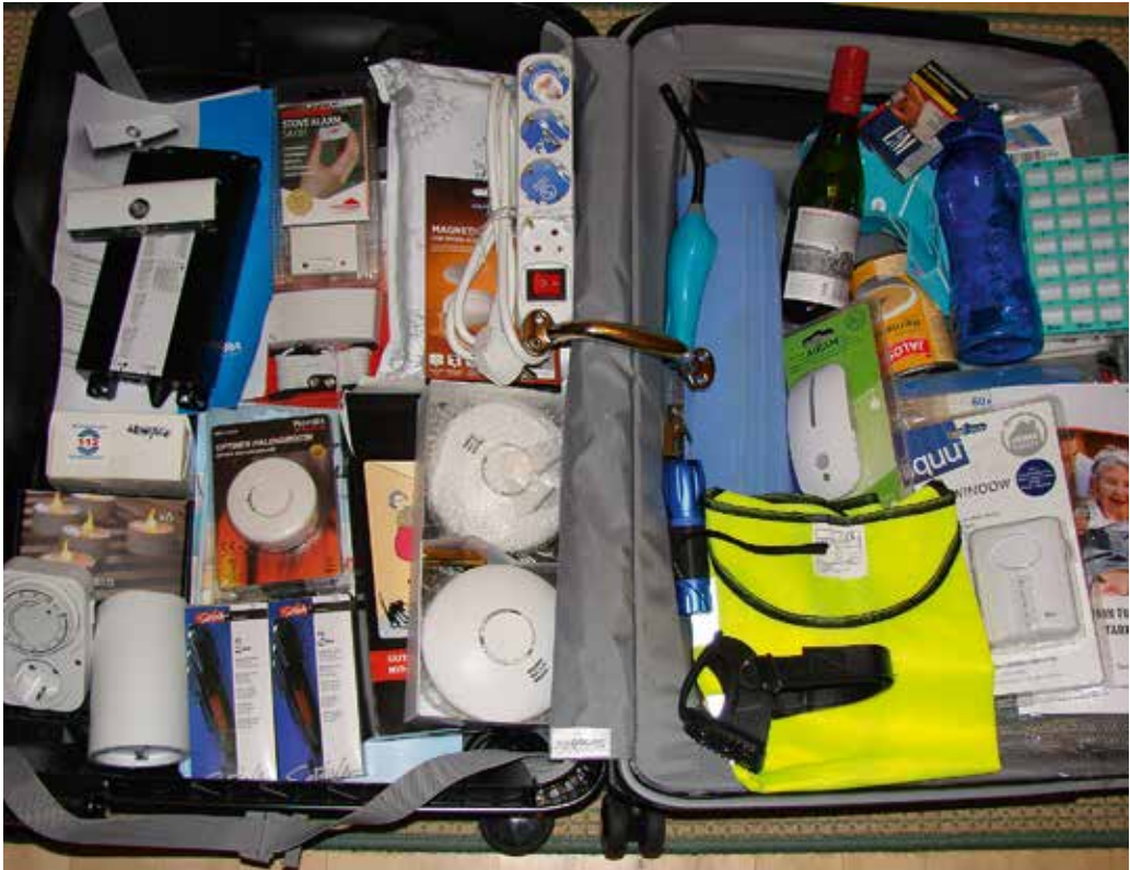
Turvakassin sisältöä.

Turvakassissa olevia ikäteknologiatuotteita: