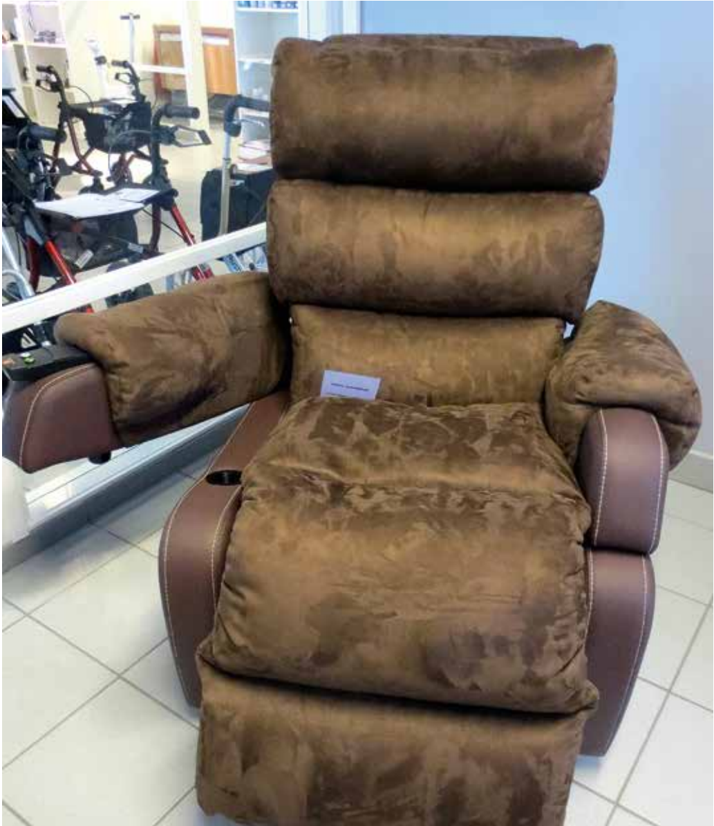
Toimiva Koti Nousuaputuoli

Lisäksi selvitettiin ammattiopistojen ja ammattikorkeakoulujen tarjoamia ikäteknologian ohjaus- ja neuvontapaikkoja, joissa ikääntyneet voivat tutustua arkea tukevaan teknologiaan ja saada opastusta laitteiden käytössä. Verkkohakuja tehtiin aiheeseen liittyvillä hakusanoilla sekä etsittiin valtakunnallisten potilas-, vammais- ja etujärjestöjen verkkosivuilta, onko niillä tällaista toimintaa. Löytyneistä esittely- ja neuvontapaikoista kysyttiin puhelinhaastattelujen ja vierailujen yhteydessä heidän tiedossaan olevista muista paikoista.