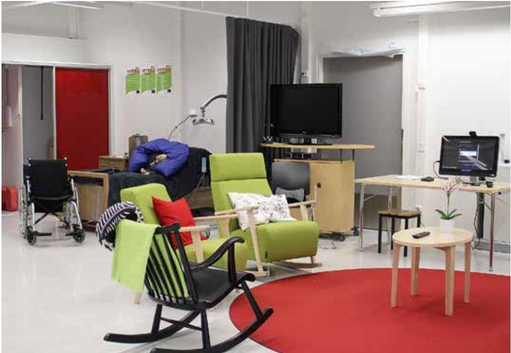
Hyvinvointiteknologia oppimisympäristö.

HYTEKS-tila on rakennettu yhteen suureen huoneeseen, johon on toteutettu kodinomaisesti makuuhuone, keittiö, WC- ja suihkutila, olohuone sekä lisäksi pieni kuntosali. Tarvittaessa WC- ja suihkutila sekä makuuhuone voidaan rajata sähköisesti toimivilla väliverhoilla. Esillä on kiintokalusteiden ja huonekalujen lisäksi laaja valikoima erilaisia turvallisuutta lisääviä sekä arkista elämää ja hoitotyötä tukevia laitteita, teknisiä ratkaisuja, pienvälineistöä sekä muun muassa Paro- ja Zora-robotit.