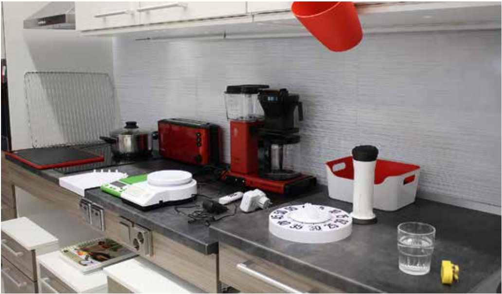
HYTEKS-tilan keittiö.

HYTEKS-tilassa järjestetään avoimien ovien tapahtumia ja ryhmille voi varata maksullisia esittelyjä. Toiminnasta tiedotetaan nettisivuilla ja sosiaalisen median kanavilla sekä jutuilla paikallislehdissä.