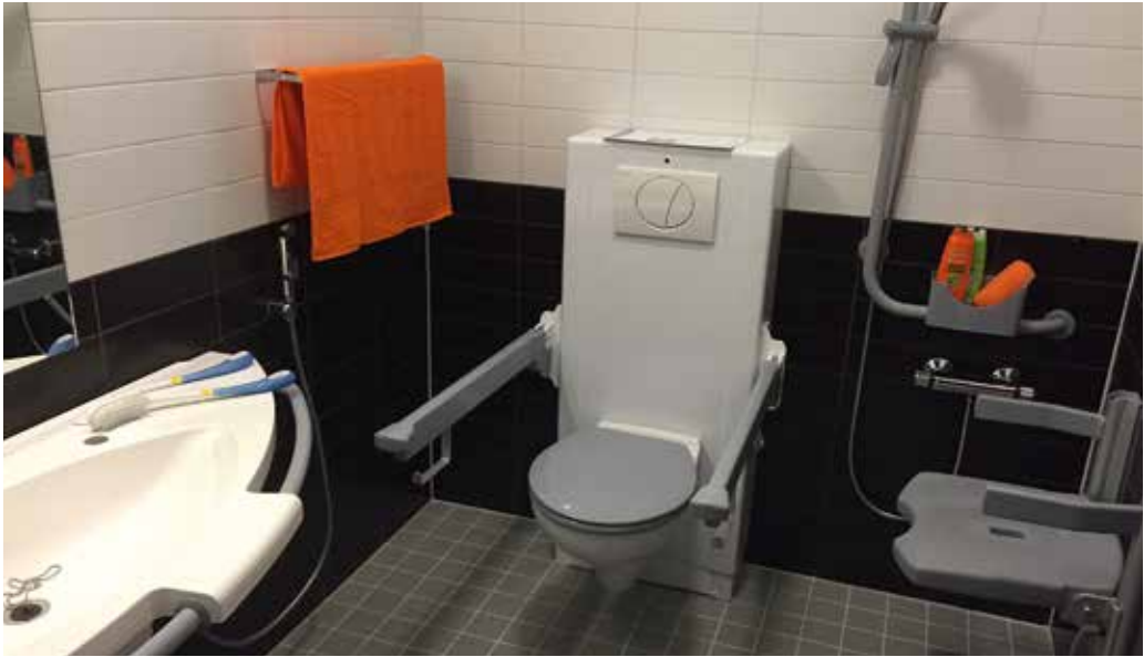
Kunnonkodin WC- ja suihkutila.

Toiminnasta tiedotetaan netti- ja Facebook-sivuilla, esitteissä, lehtijutuissa sekä sähköpostitse verkostoille. Palauteiden perusteella toiminnalle on edelleen suuri tarve ja palvelun laatuun ollaan oltu tyytyväisiä.